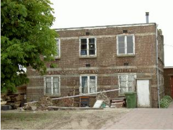
Voorgevel van de bollenschuur op no. 46a