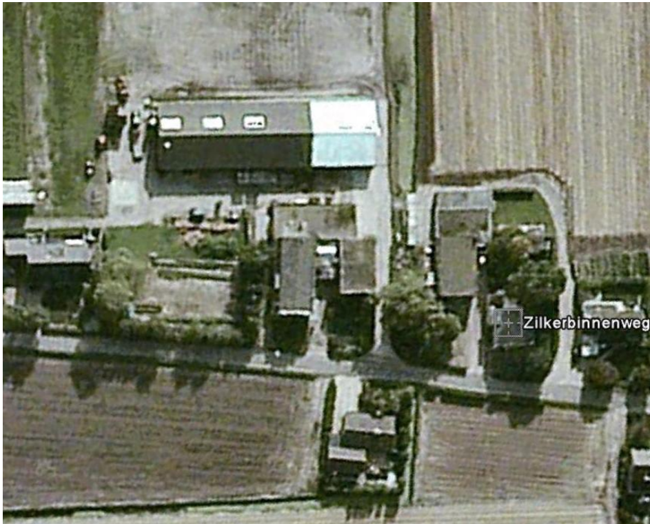
Zilkerbinnenweg met v.l.n.r.: no. 48, 48a, 46a en 46.