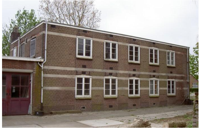
Zijgevel van Zilkerbinnenweg 46a