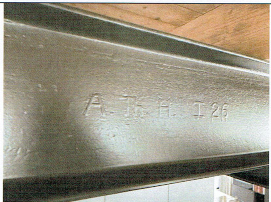
14. Opschrift op H-balk (2022)