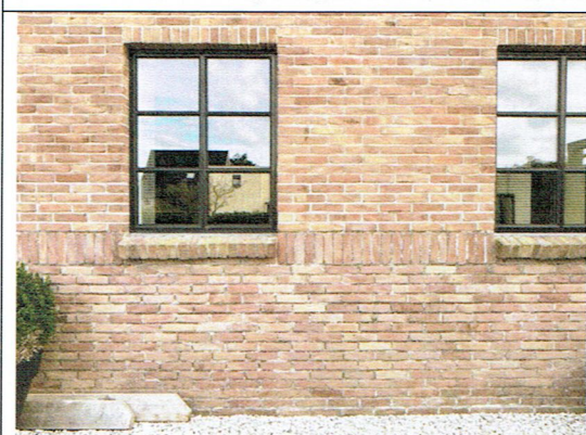
7. Geveldetail met plint noordgevel (2022)