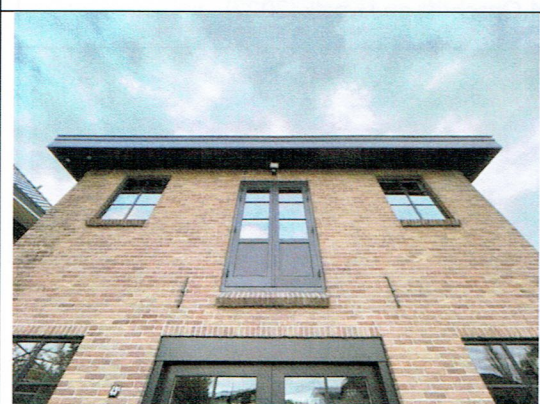
9. Geveldetail voorgevel met daklijst O (2022)