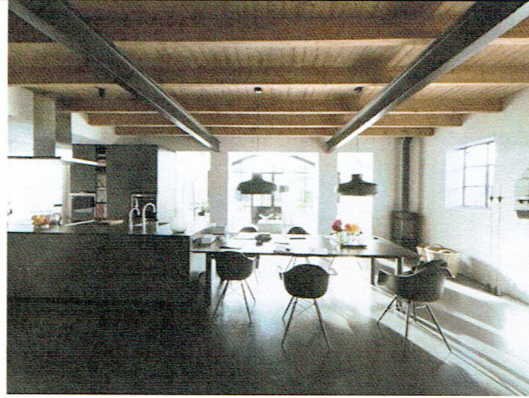
11. Overzicht ruimte begane grond naar westen (2022)