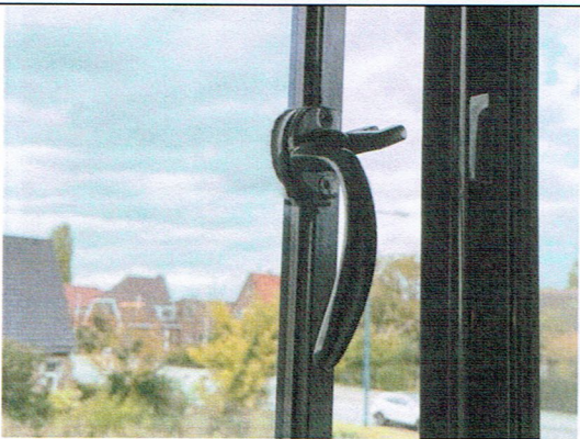
15. Handgreep venster (herplaatst)