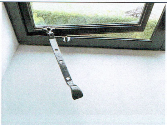
16. Raamuitzetter venster (herplaatst)