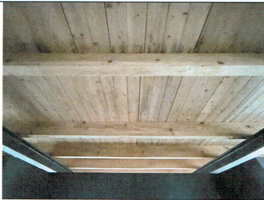
13. Plafond detail eerste verdieping (2022)