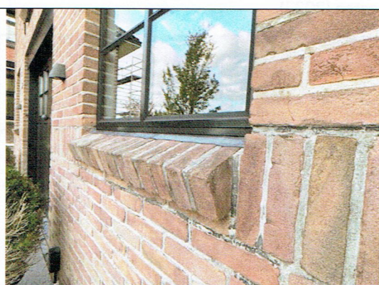
8. Geveldetail met vensterbank O (2022)