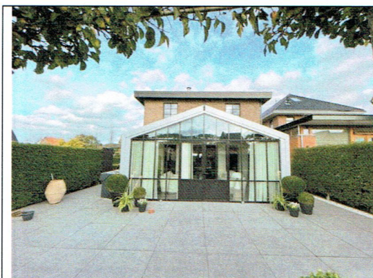
5. Achtergevel W (2022)