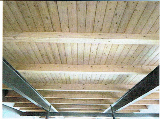
12. Deel van plafond begane grond (2022)