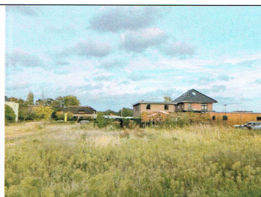
6. Achtergevel vanuit het westen gezien (2022)